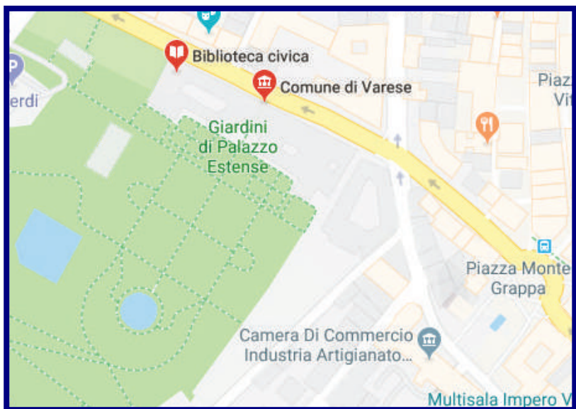
Biblioteca Civica di Varese via L. Sacco, 9